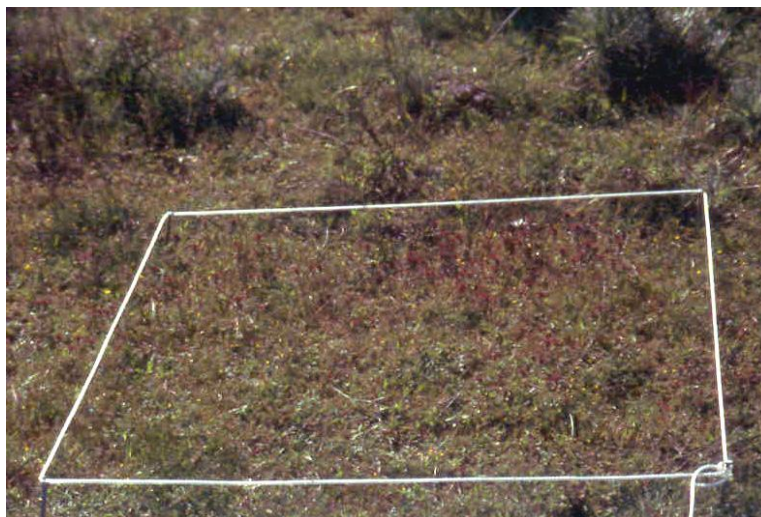
Figura1. Cálculo del área mínima de una comunidad vegetal de pastizal

Esté método consta de dos fases, la primera de carácter analítica tiene una gran importancia, pues debe hacerse de forma minuciosa la selección de las parcelas de muestreo, la segunda fase será de tipo sintético. Con este método se seleccionan parcelas homogéneas y se toma la cobertura total de la fitocenosis. El grado de cobertura se da en % y representa la superficie de suelo cubierta de vegetación. Para calcular el porcentaje de cobertura se mide la parcela muestreada que tendrá un valor variable dependiendo del tipo de fitocenosis, del bioma en el que está integrada la comunidad vegetal, por ejemplo en áreas mediterráneas el área de muestreo para los bosques suele oscilar entre 300-500 m^2 , mientras que en zonas tropicales y subtropicales este área debe incrementarse aproximadamente a 1000-2000 m^2 , para las comunidades de matorral se toman entre 50-200 m^2 , los pastizales entre 0,5-2 m^2 ., en todos los casos es conveniente realizar el cálculo del área mínima para obtener la máxima diversidad florística en la mínima superficie. Si una parcela tiene 100 m^2 y hay cubiertos 45 m^2 , significa que el grado de cobertura es del 45%.